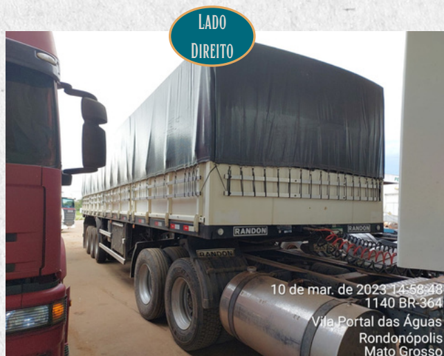
Foto na diagonal pegando a lateral direita da carreta