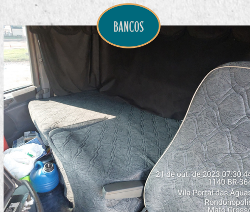
Foto de cima do banco