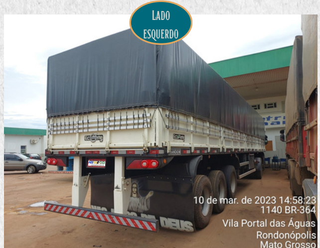
Foto pegando a lateral esquerda da carreta