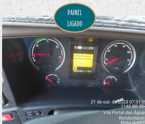
Foto do painel com a chave ligada