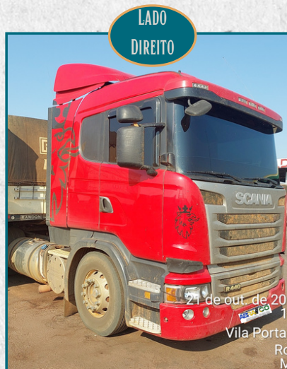
Foto na diagonal pegando a lateral direita do veículo