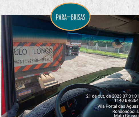
FOTO DO PAINEL LIGADO