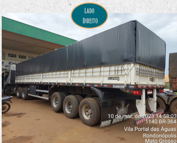
Foto pegando a lateral direita da carreta